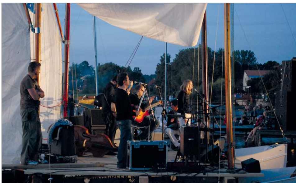
Delikatne oświetlenie budowało klimat koncertu.