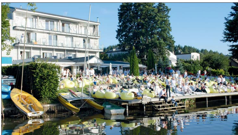
Publiczność w oczekiwaniu na gwiazdę wieczoru.