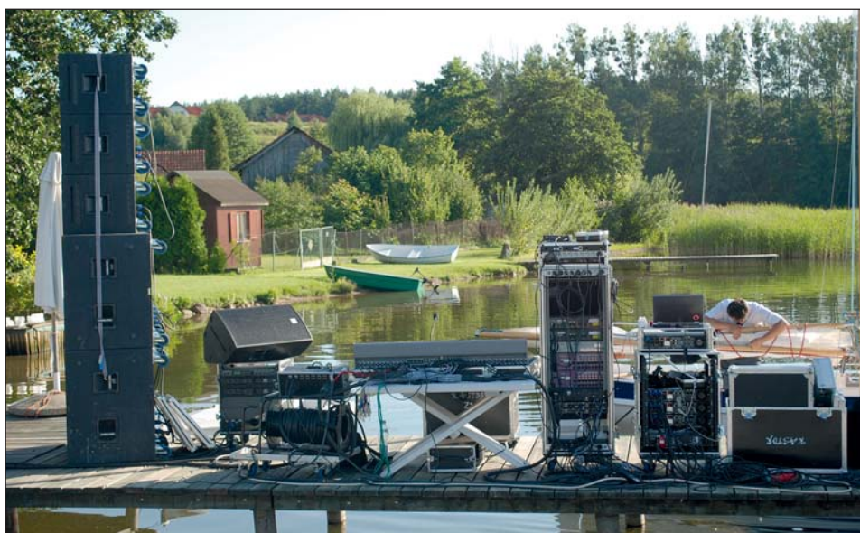
Stanowisko realizatora monitorów.