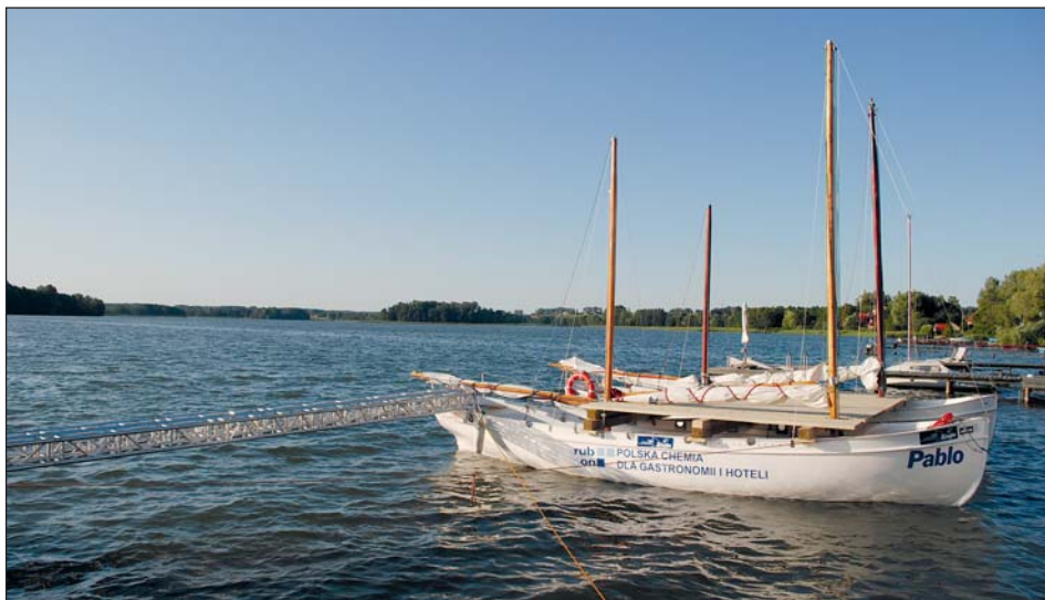
Scena wypływa na szerokie wody Jeziora Wólpińskiego.