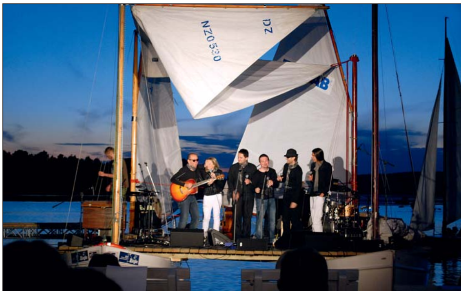
Wieczorem sceneria robiła jeszcze większe wrażenie.